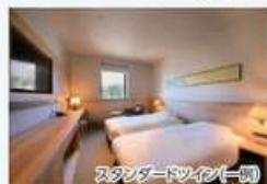
スタンダードツイン(一例)