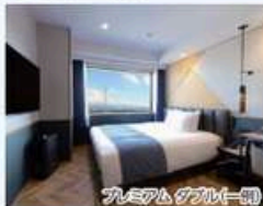
プレミアムダブル(一例)