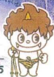
きじマスノーパーク公式キャラクター 鬼島っち