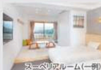
スーベリアルーム(一例)