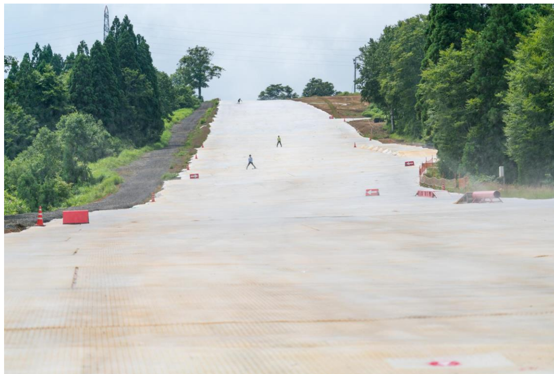
国内最大級全長1,100mスノーマットゲレンデ